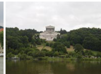
Ankerplatz bei Walhalla