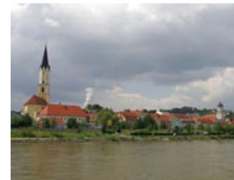
KM 2248, Vilshofen