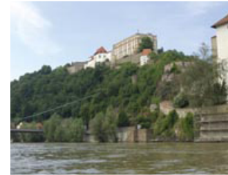
KM 2225, Passau

Herrliche Landschaften und einzigartige Natur macht Ihre Bootstour zu einem unvergesslichen Urlaub.