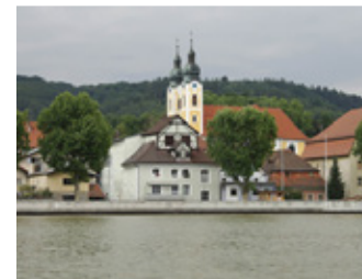
KM 2210, Oberzell