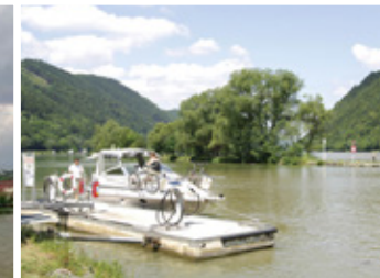
Die Tankstelle in Schlögen